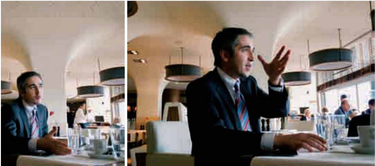
Niko nije savršen, ali tim može biti